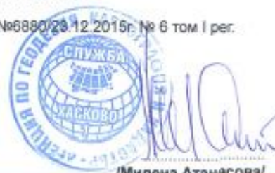
Схема № 15-987136-22.10.2020 г. издадена въз основа на заявление с входящ № 01-485111-20.10.2020 г.